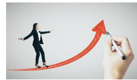
La Manager Academy