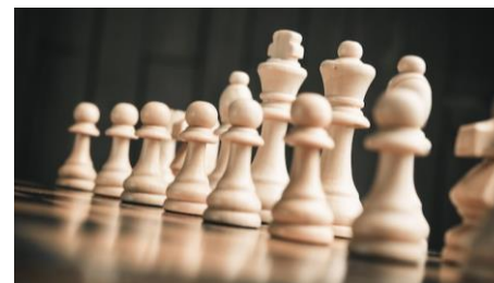
La vision partagée