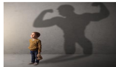
La New Biz Academy