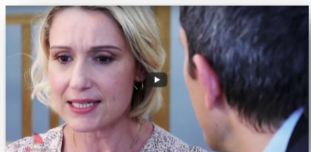
Gentil, ce n'est pas un métier