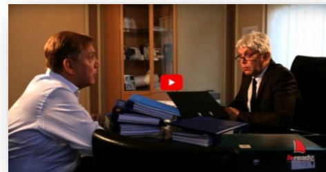
Le vrai problème