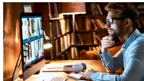
Les têtes à tête