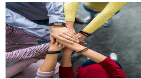
Les escape games

Vous trouverez les plaquettes détaillées de nos différents formats d'accompagnement sur notre site Internet : www.b-ready.team