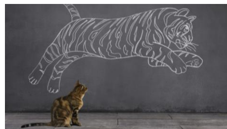
La Performance Academy