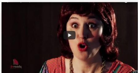
Expert-comptable : un métier d'avenir ?